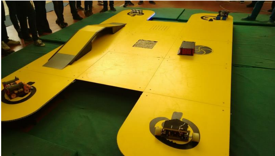
Ilustración 1. Escenario de sumo.